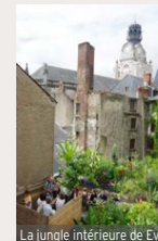
La Jungle intérieure de Evor

Vous êtes invités à rester sur place pour parcourir la Folie des Plantes, au parc du Grand Blottereau, avec ses 200 exposants. La manifestation de référence du Grand Ouest.