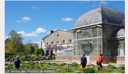
Le Jardin des Plantes de Nantes