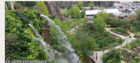
Le Jardin extraordinaire