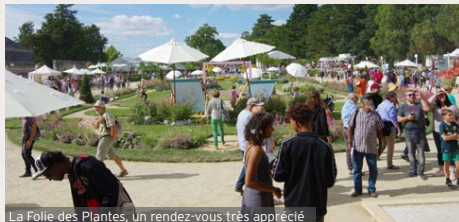
La Folie des Plantes, un rendez-vous très apprécié