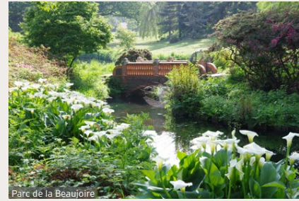
Parc de la Beaujoire