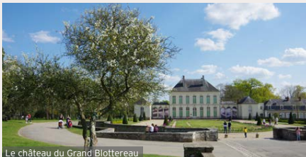
Le château du Grand Blottereau